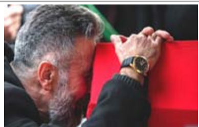
梵蒂岡新聞網）土耳其伊斯坦布爾市中心的一條大街11月13日

Saeng主教是一名達雅克族苦難會會士，於6月被教宗方濟各任命為主教，並接替門庫奇尼(Giulio Mencuccini)主教，這位意大利籍自90年代以來一直負責領導該教區，現